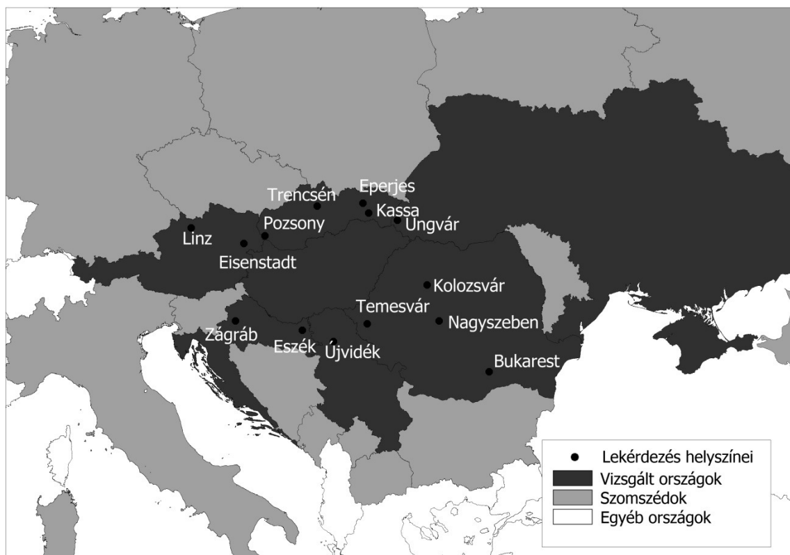
1. ábra: A vizsgálati térség

A 2. ábra összefoglalja a válaszokból kikövetkeztethető eredményeket. Az ábra azt mutatja meg, hogy az egyes országokat a válaszadók mekkora aránya „szavazta be” az egyes térkategóriákba.