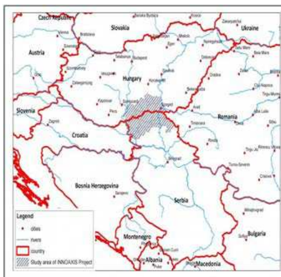
1.ábra: A határ menti kutatási terület elhelyezkedése

A vizsgált határ menti övezet a Duna–Tisza között foglal el sajátos geográfiai pozíciót, amelyet a jelenlegi határ (175 km hosszan) már csaknem egy évszázada kettéválaszt (1. ábra).