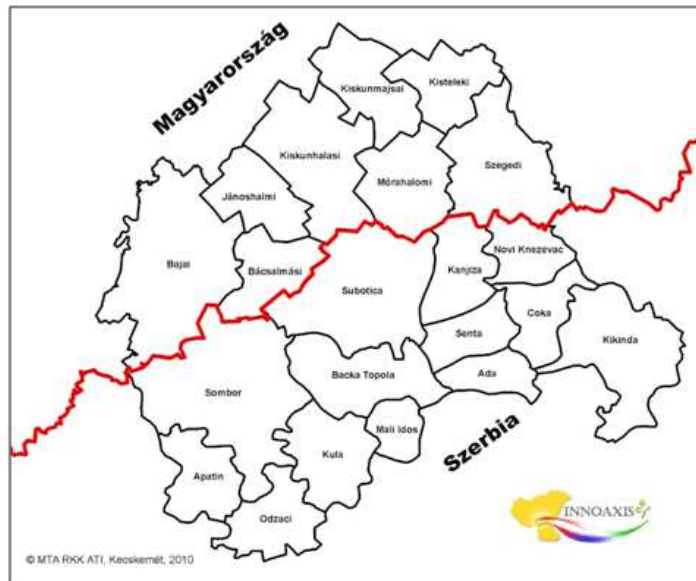
2. ábra: A kutatásban kijelölt határ menti régió és „kvázi kistérségei”