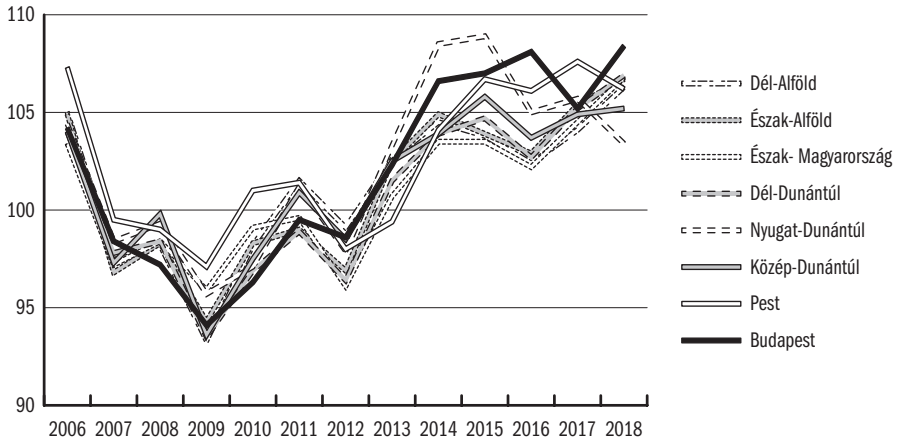
10.3. ábra: A régiók kiskereskedelmi forgalmának alakulása, 2006–2018 (előző év=100)

A negatív pólusra a folyamatos súlyvesztést elszenvedő Dél-Dunántúl (a Dél-Balaton szezonális forgalma ellenére), ahol 10-ről 8%-ra mérséklődött a részesedés, valamint a 2010-től leszakadó pályára álló Észak-Magyarország (10-ről 9%-ra) került. A Nyugat-Dunántúl kedvező gazdasági pozíciója 2014–2015-ben tükröződik a fogyasztási adatokban, a Közép-Dunántúl szintén kedvező gazdasági adatai csak a kiskereskedelmi forgalomban elért korábbi súly megtartására voltak elegendőek (10.3. ábra).