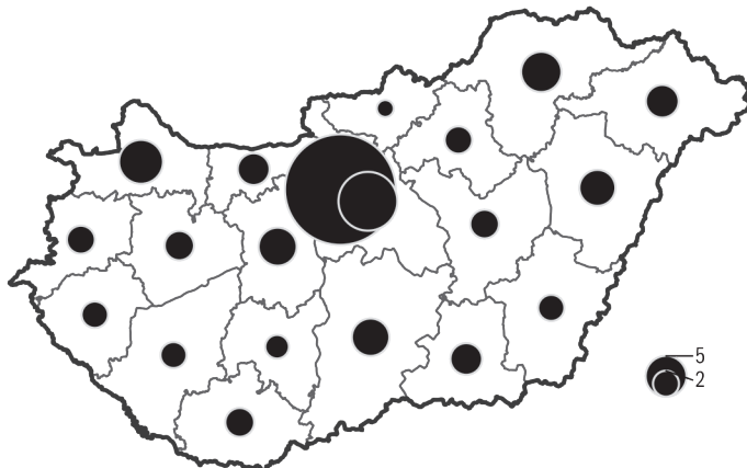
8.2. ábra: A bruttó hazai termék (2005-ös árakon) megyei megoszlása, 2018 (%)