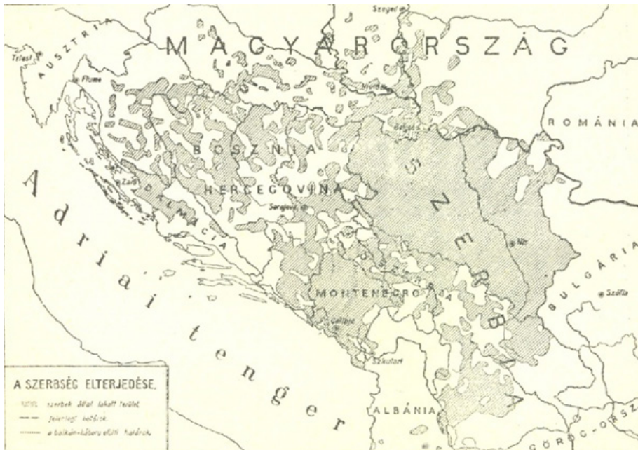
1. ábra: A szerbség elterjedése

A „délszláv testvérepeken” kívül szállásterületi „átfedésekkel” a szerb közösségek albánokkal, magyarokkal, németekkel, olaszokkal is együtt éltek.