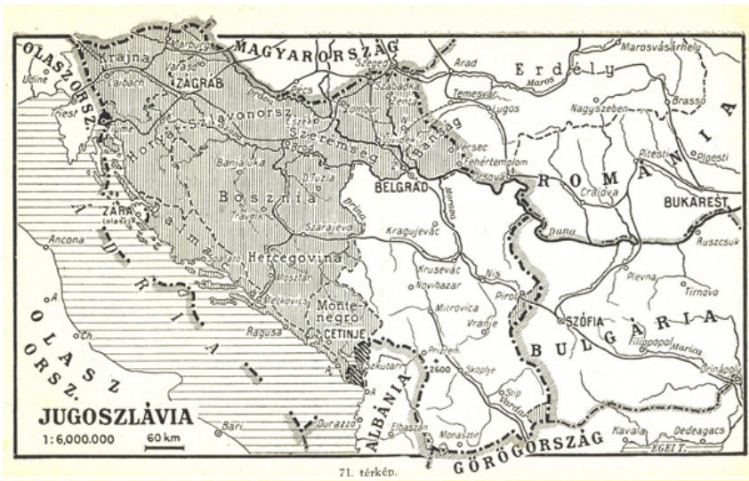
2. ábra: Az OMM-től elcsatolt területek és népesség helyzete az új Jugoszláviában, 1920

kb. 3,9%-át tette ki. A magyar népesség nagy része a szerbiai Bácskában és a Bánátban, a közös határ-menti területeken élt. A horvát és szlovén részekén kisebb lélekszámú „tömb” magyarság volt, de inkább csak számottevő nyelviszigeteket képezett.