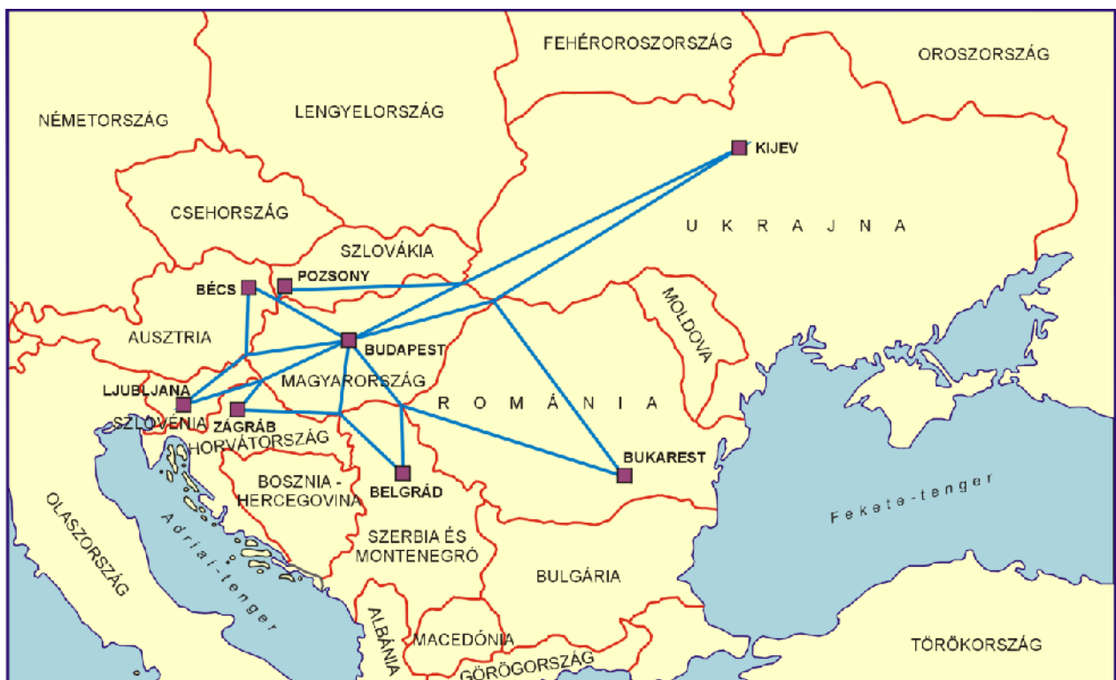
2. ábra: Magyarország határainak szomszédsági fővárosi látószögei, 2004-ben, az ország EU csatlakozásakor

A Magyarország és szomszédjai egy részének uniós csatlakozásakor a Kárpát-medence területe az egyik államterületileg leginkább felszabdalt egységnek volt tekinthető Európában (2. ábra). A medencében területileg jelen lévő, érdeket államok eltérő módon voltak jelen, de mindegyik fővárosból sajátosan tekintettek az alvízi Magyarországgal közös határaikra.