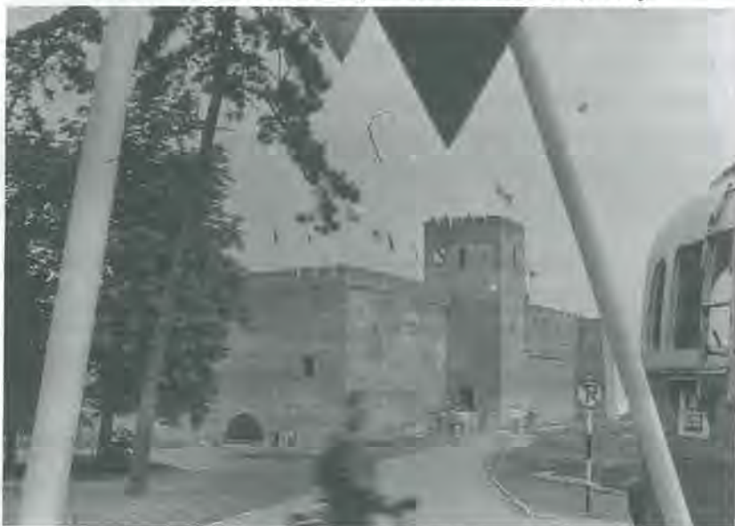
4. kép: A Gyulai Vár tömbje a helyreállítást követően (1964) Photo 4. Gyula Fortress after the renovation (1964)