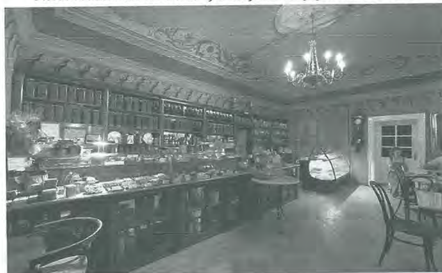
7. kép: A Százéves Cukrászda klasszicista belső tere (alapítva 1843-ban) Photo 7. Classicist interior of a confectionery, founded in 1843