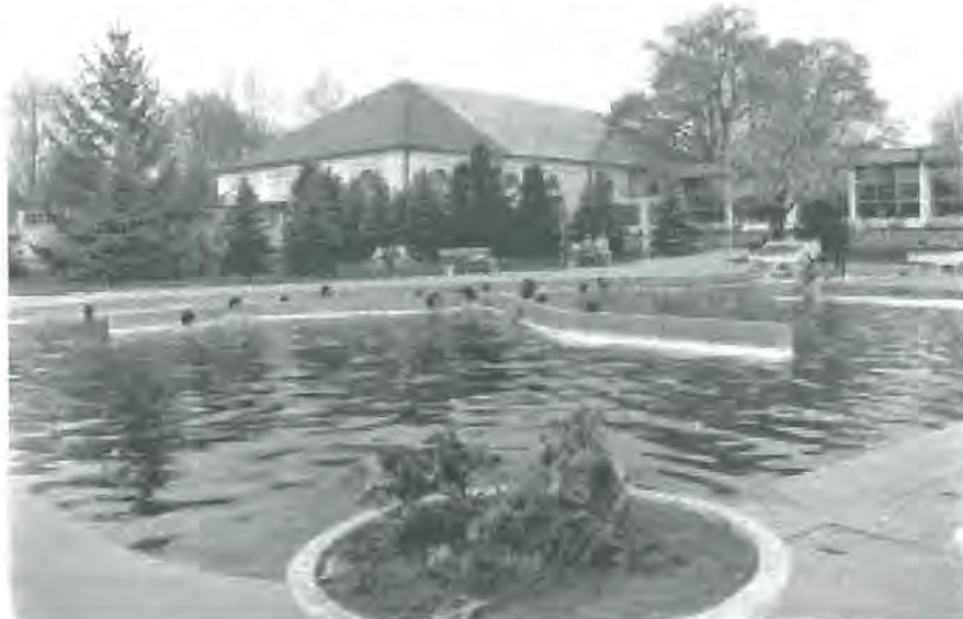
5. kép: A Várfürdő medencéi a szocializmusban (1967) Photo 5. The Bath of Gyula before the mass tourism, in 1967