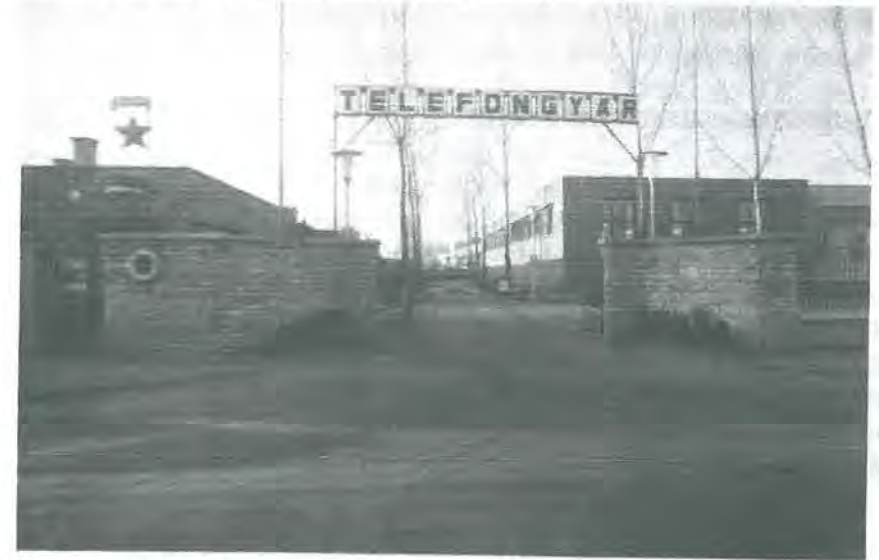
Photo 2. The entrance of wired telephone factory in the early 1970s

2. kép: A Telefongyár bejárata az 1970-es évek elején.