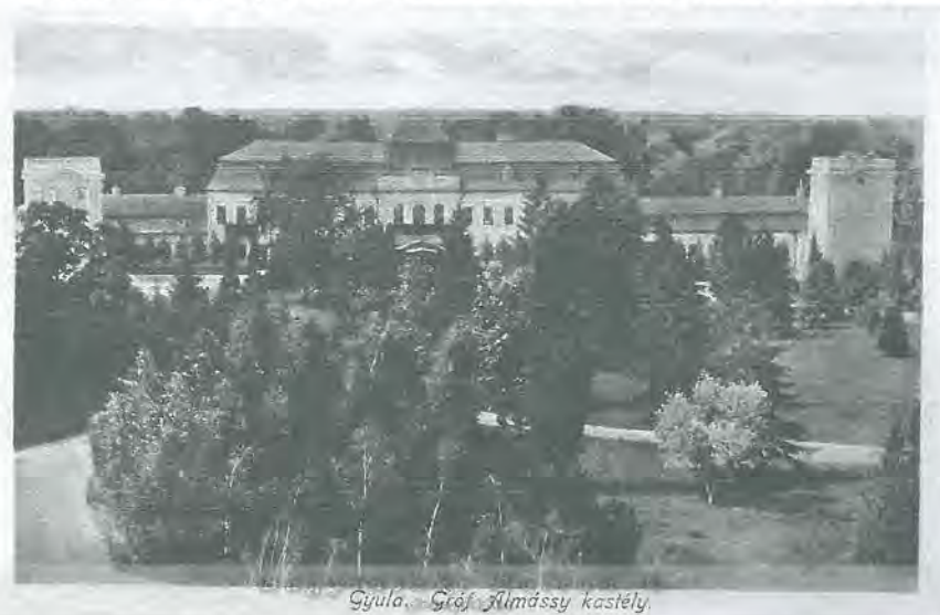
6. kép: A Gróf Almássy-kastély, még mint szociális gyermekotthon (1970-es évek) Photo 6. Almássy Castle used as a child care home in the 1970es