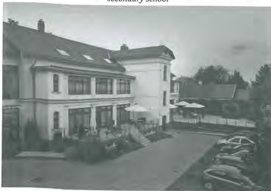
Photo 8. Four star Hotel, near the Fortress – former function: dormitory for a secondary school

8. kép: Négycsillagos hotel a Vár közelében – korábbi funkciója középiskolai kollégium