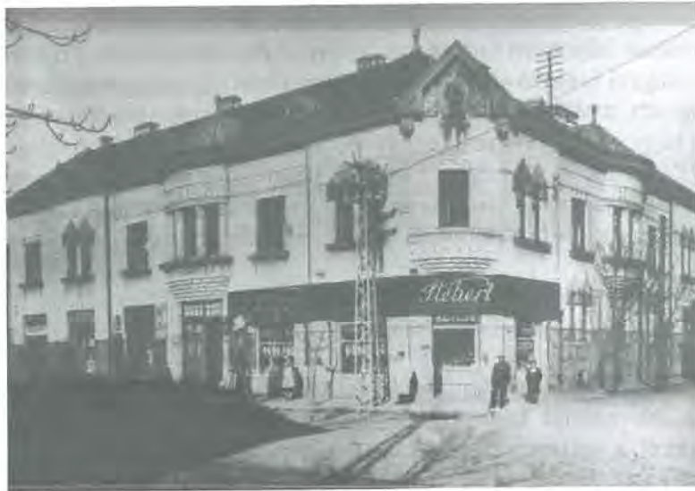
Photo 1. Shop of a local sausage factory in favourable location near the town centre, in 1937