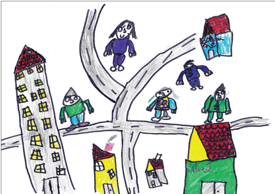
2. kép: A megszelídített tér