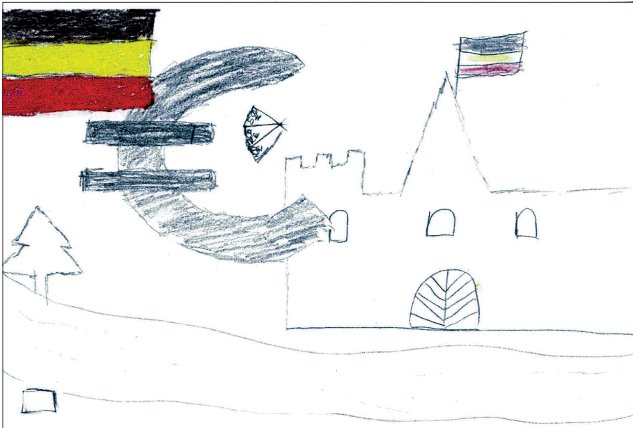
4. kép: Mese és valóság