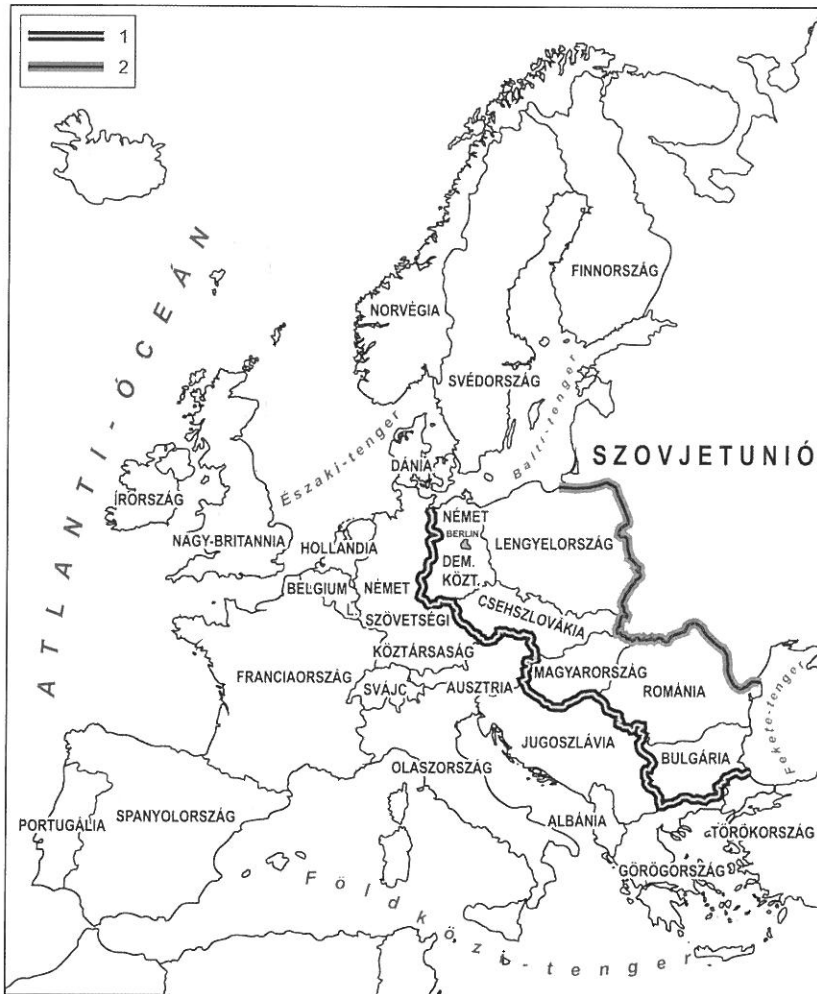
4. ábra. A kettős vasfüggöny, 1949–1989 (szerk. Hajdú Z.)

A kettős vasfüggöny közötti területek valójában egymással is csak korlátozott intenzitású kapcsolatokat tartottak fenn, elsősorban a Szovjetunióra fűződtek fel szinte minden tekintetben.